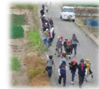
お世話になったサポーターズ、保護者のみなさんに皆でお礼をしました。